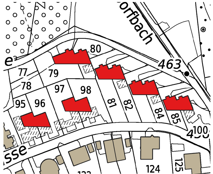
Übersichtsplan, M 1:1'500 (Amt für Raumentwicklung Zürich)

Erhaltung der Gesamtanlage. Erhaltung der bauzeitlichen Substanz aller Bauten mitsamt den festen Ausstattungselementen.